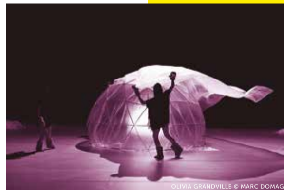
OLIVIA GRANDVILLE