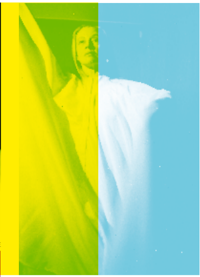
JACQUELINE ROBINSON