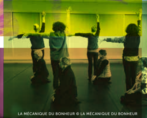
LA MÉCANIQUE DU BONHEUR © LA MÉCANIQUE DU BONHEUR