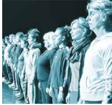
ATELIER CHOREGRAPHIQUE