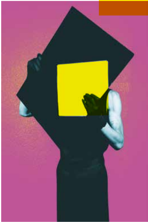
EMMANUEL EGGERMONT © JIHYE JUNG