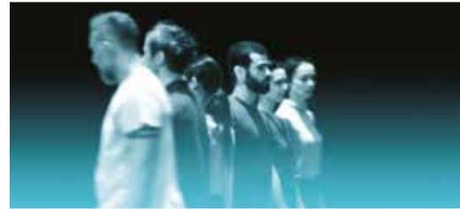
FILIFE LOURENÇO